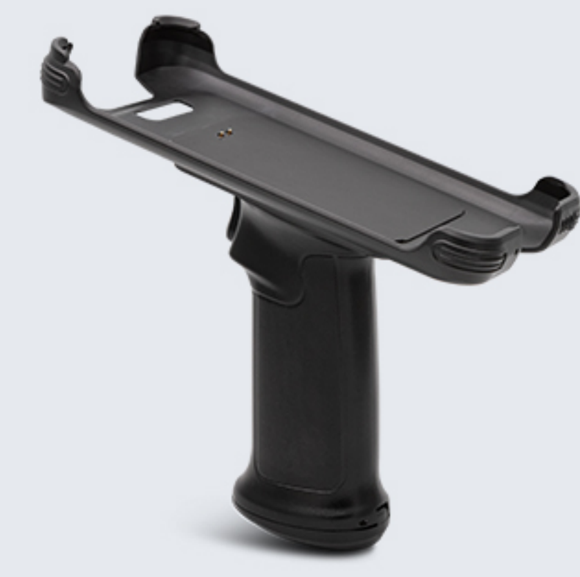
RB-C50-PS 手柄背夹，手柄按键可用于条码触发。