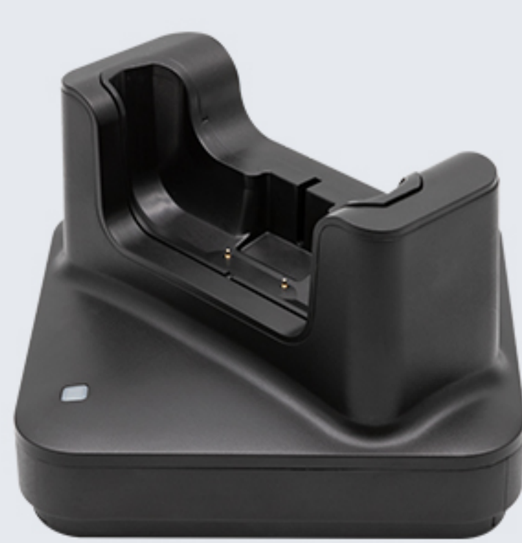
CRD-C50-RBC 主机单充， 使用12V2A适配器，DC口。