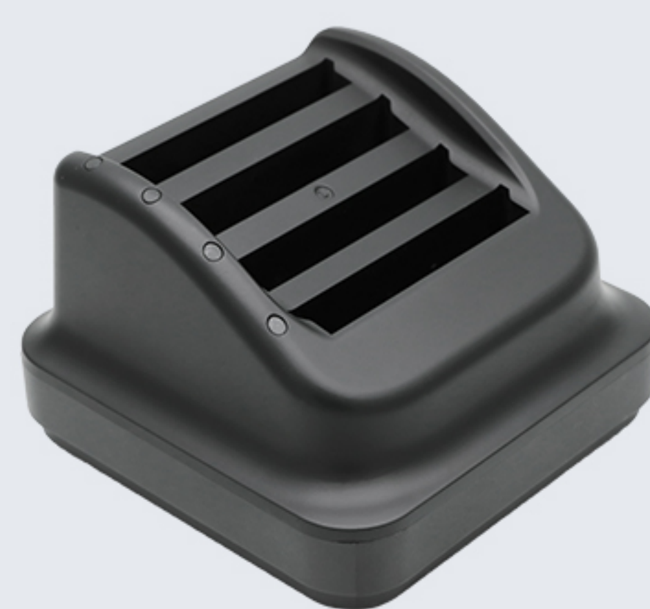
CRD-C50-MBC 主机电池4充，与适配器 DCPWR-12V2A-XX 配套使用。