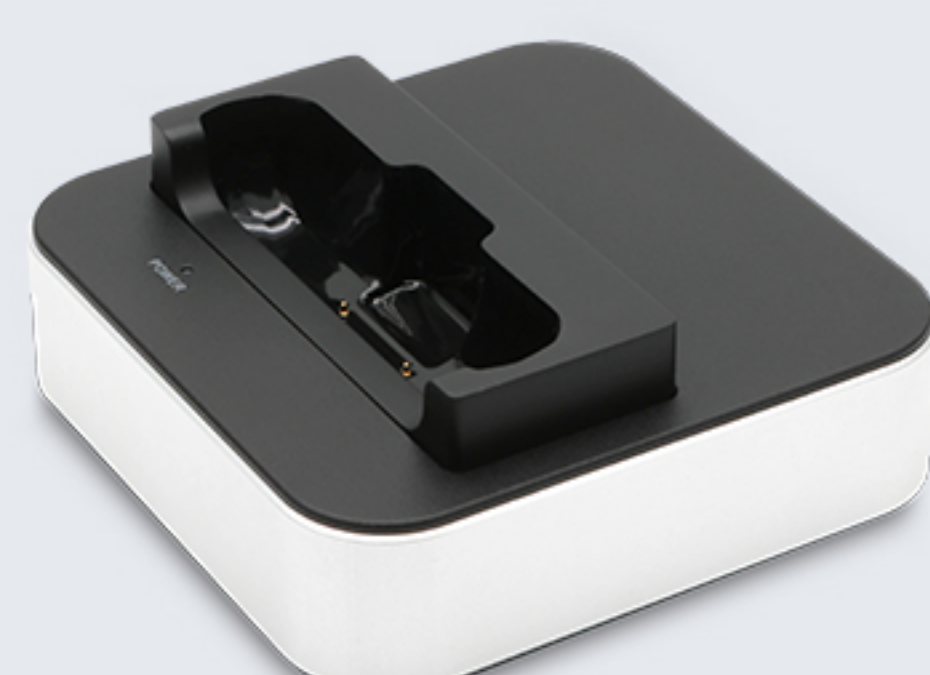
CRD-C50-SCC 主机单充，使用 10W/18W 适配器， Type-C口。