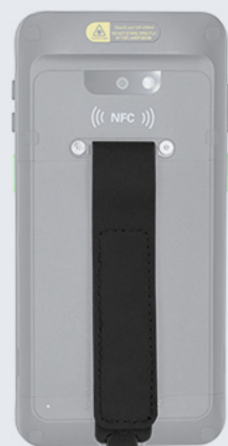
RB-C50-HS 腕带（需配腕带组件安装，包括2个 螺丝，1个腕带扣，1条腕带）。