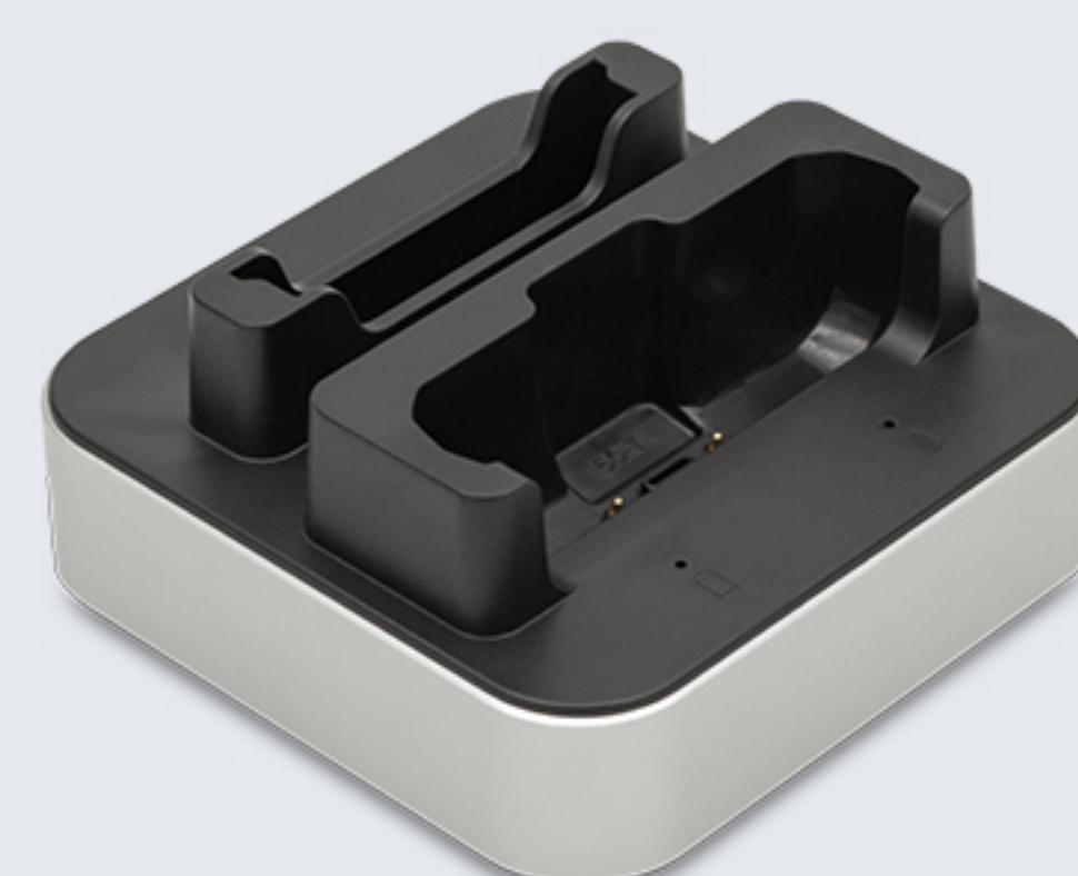
CRD-C50-DBC 主机&电池组合充电座， 使用18W快充适配器，Type-C口。