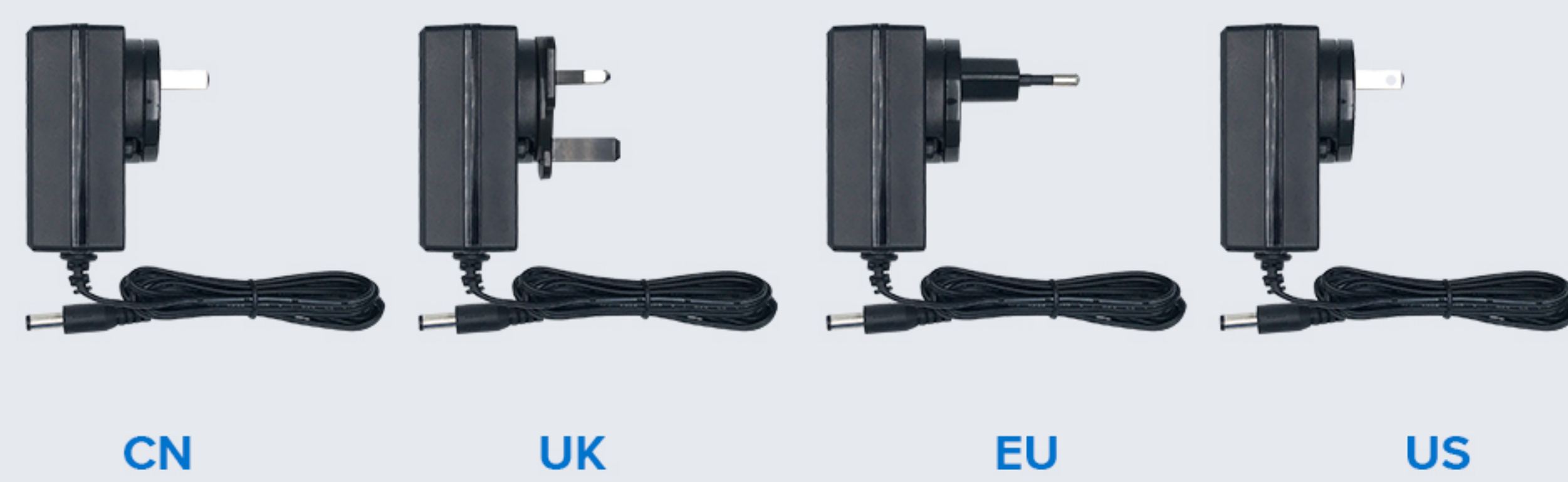
DCPWR-12V2A-CN/UK/EU/US 主机单充，使用12V2A适配器，DC口。