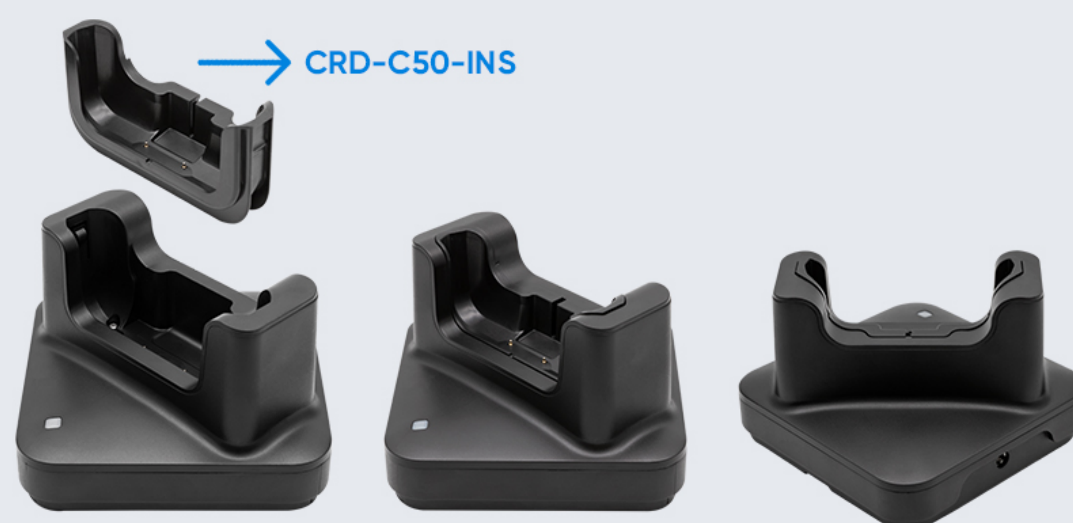
CRD-C50-DP 主机（带UHF手柄背夹）单充，含主机适配组件CRD-C50-INS，支持UHF手柄带主机，或单主机设备充电，与适配器DCPWR-12V2A-XX配套使用。 当给UHF手柄带主机设备充电时，请提前移除主机适配器组件